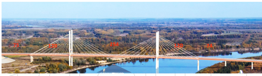
Схема вантового внеклассного моста через р. Оку

Пойменная часть – 728 м Схема (74+2x75+66+65)+(65+3x66+2x50) м