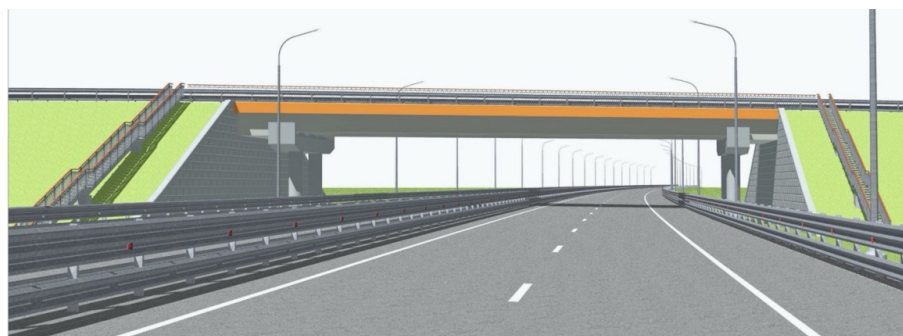
Типовой путепровод над основным ходом

Запроектировано 32 ИССО суммарной длиной 1877 м; 14 мостов и путепроводов суммарной длиной 1073 м с пролетными строениями из сборных железобетонных балок, объединенных монолитной железобетонной плитой, с пролетами до 33 м; 13 путепроводов суммарной длиной 594 м с пролетными строениями из сборных железобетонных балок, объединенных монолитной железобетонной плитой,