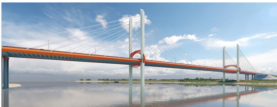
Вантовый внеклассный мост через р. Оку