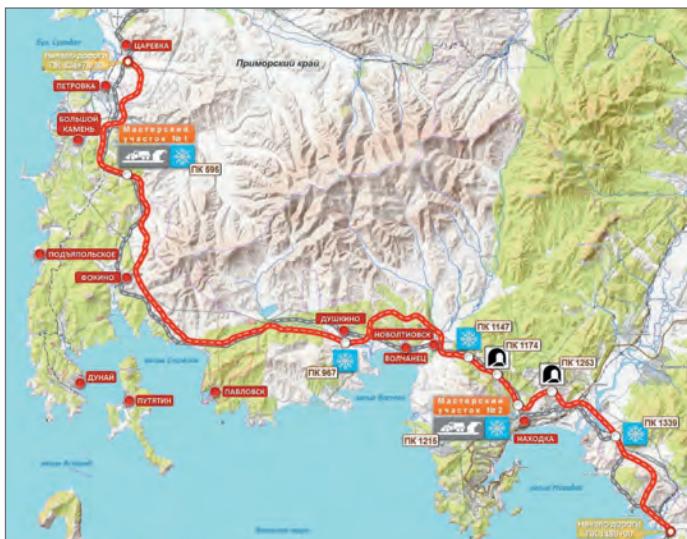
Схема автомобильной дороги Владивосток — Находка

появился еще один проект, со статусом федерального, — «Мосты и путепроводы». Его бюджет составляет 507 млрд рублей. Срок реализации — 2020-2024 гг. Проект рассчитан исключительно на регионы, которые будут получать федеральные субсидии на ремонт и строительство мостов и путепроводов. Общий объем финансирования по трем проектам — 11,66 трлн рублей. Это рекордные суммы за всю новейшую историю России. Правда, в 2019 году Правительство очень медленно раскачивалось с началом реального финансирования по нацпроектам, за исключением БКАД. Но все же во второй половине 2019 года движение началось.