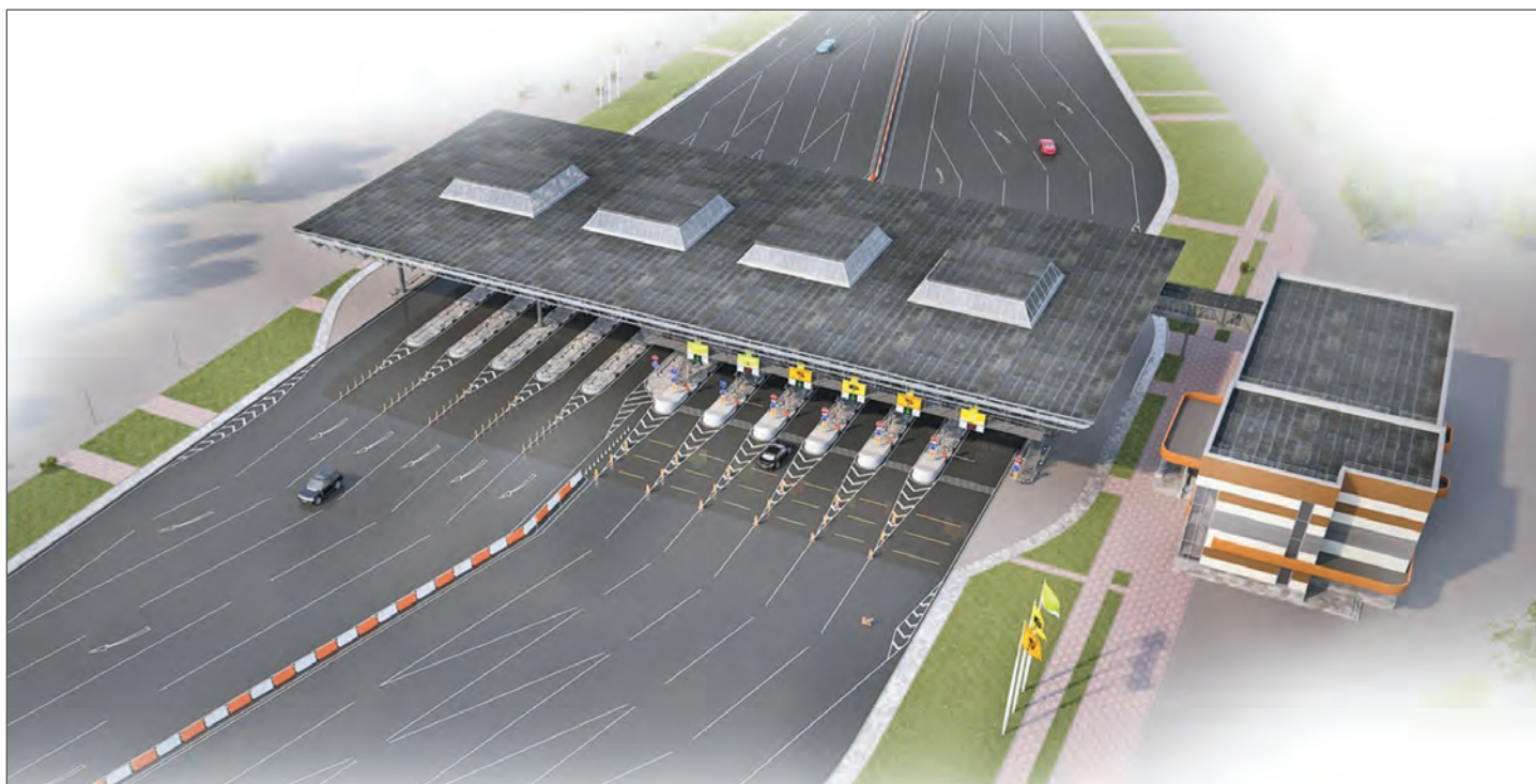
Автодорога Пермь — Березники. Пункт взимания платы