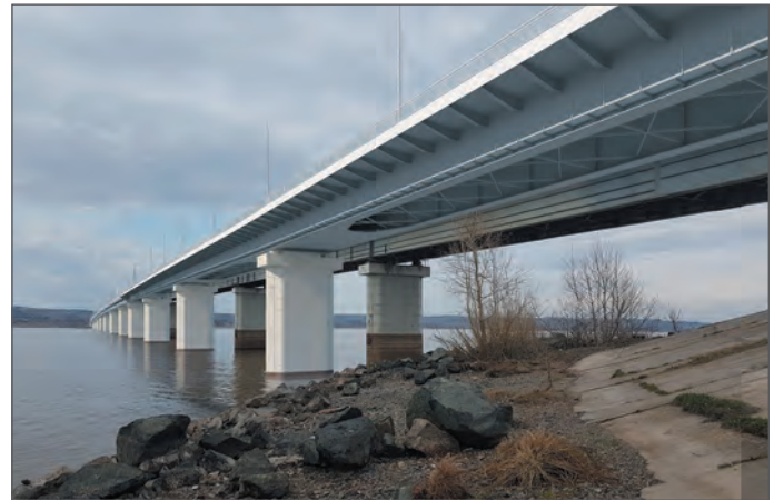
Автодорога Пермь – Березники. Мостовой переход через р. Чусовую

Для того чтобы организация всегда оставалась дееспособной, еще очень важно, чтобы ее сотрудники были членами одной команды, заточенной на реализацию единой цели. Создание атмосферы единой команды, состоит ли она из четырех человек или более тысячи пятисот, как сейчас, является краеугольным камнем корпоративной культуры Стройпроекта. Это реализуется и созданием комфортных условий труда, и развитым социальным пакетом, и проведением различного рода корпоративных мероприятий, тренингов, обучений, КВН, квестов. И делается это не потому, что какой-то умный консультант так посоветовал делать, а потому, что для Стройпроекта это естественный путь развития. Традиции маленького коллектива распространяются и на огромную сегодняшнюю команду. Когда создавался первый трудовой договор Стройпроекта — это был продукт коллективного творчества. В нем появился такой пункт, которого нет ни в одном трудовом кодексе. Он звучит так: «Специалист обязуется поддерживать доброжелательные рабочие