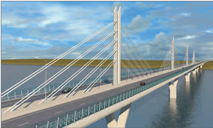
Мост через р. Каму