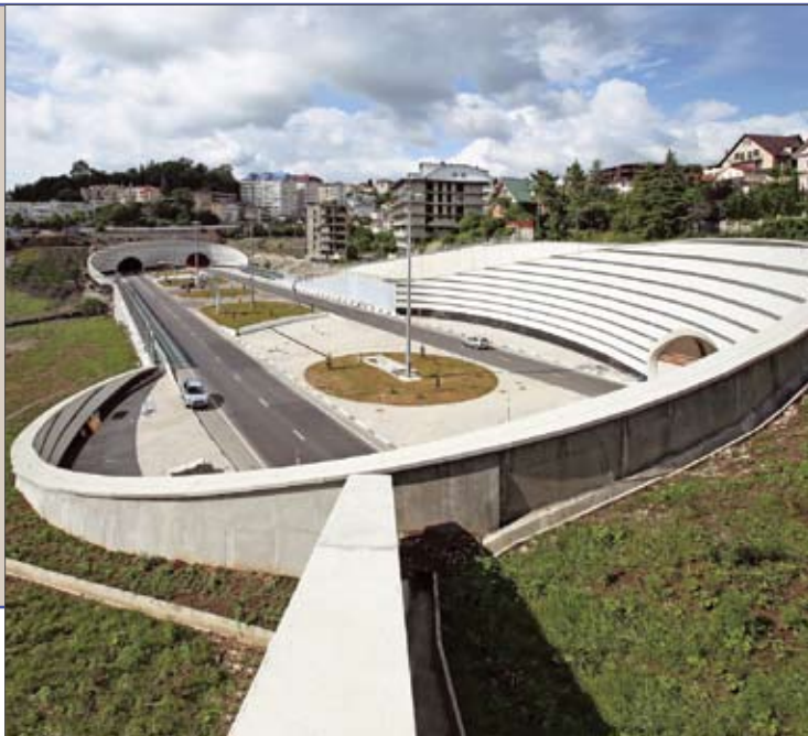
Транспортный тоннель олимпийского Сочи